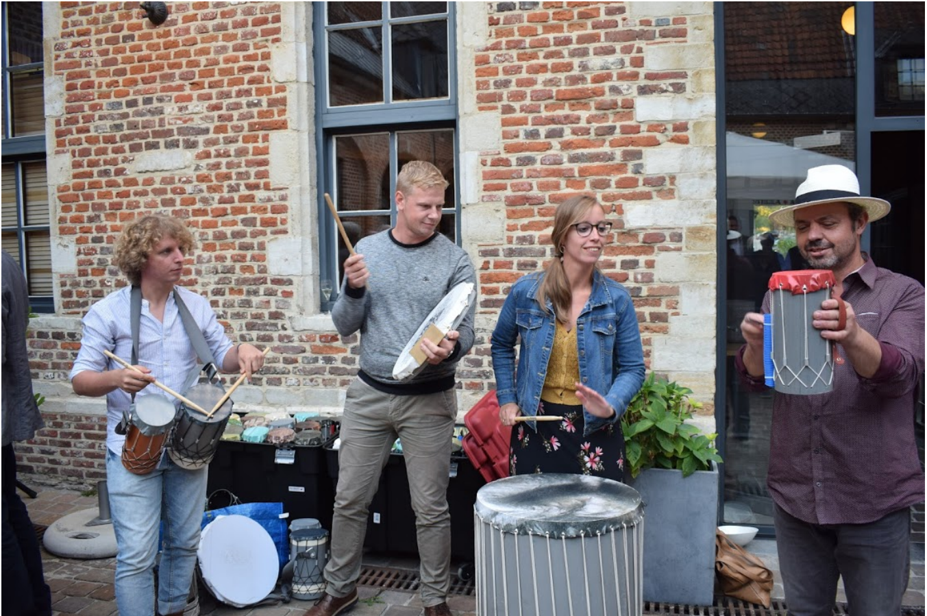
Kwalitatieve instrumenten bieden tal van mogelijkheden om verschillende muziekstijlen te bewandelen