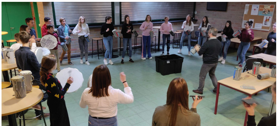
De initiatielessen gaan door tijdens de lessen Muzikale Opvoeding of Muzische Vorming.