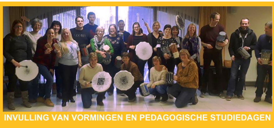
INVULLING VAN VORMINGEN EN PEDAGOGISCHE STUDIEDAGEN

Na onderling overleg. Mogelijkheid tot ondersteuning via STEMACADEMIE