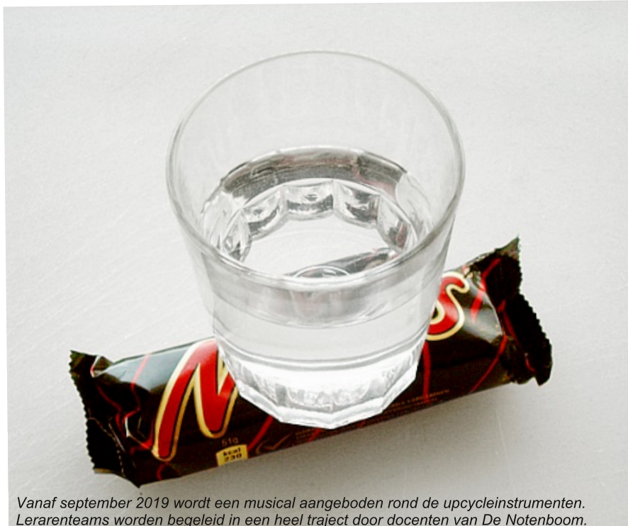
Vanaf september 2019 wordt een musical aangeboden rond de upcycleinstrumenten. Lerarenteams worden begeleid in een heel traject door docenten van De Notenboom.

MATERIALEN EN NODIGE GEREEDSCHAP WORDEN VOORZIEN